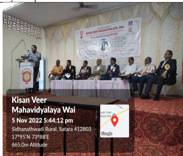
Participant expressing his opinion about the Seminar in Valedictory Function